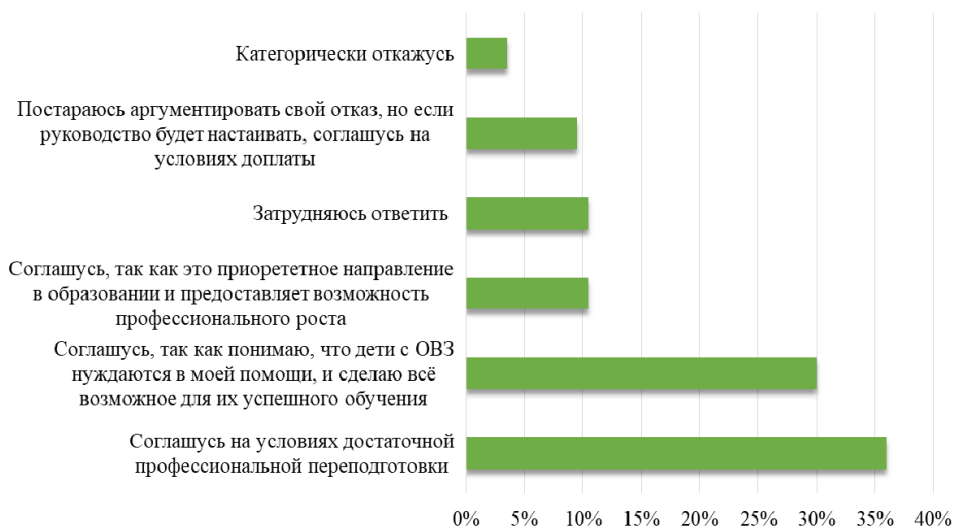
Рисунок 2. Согласие студентов ИвГУ работать в группе с детьми с особенностями Figure 2. Consent of IvSU students to work in a group with children with special needs

Далее необходимо было изучить, как респонденты соотносят между собой психологическую готовность и способность к преподаванию в инклюзивной среде. С этой целью был задан вопрос: «Считаете ли вы себя психологически и профессионально готовыми к работе с детьми с ОВЗ?» – мнения студентов разделились (рисунок 3). 44% считают, что готовы психологически, но чувствуют недостаток профессиональных навыков. Только 12% считают, что их профессиональных и психологических особенностей будет достаточно для преподавания в инклюзии.