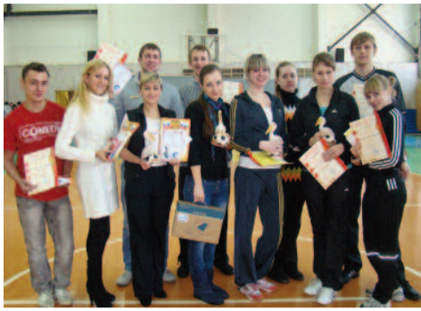
На снимке: участники конкурса.