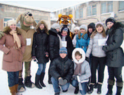
На снимке: волонтеры ШГПУ.

тории ШКЦ расположено три корпуса. В одном, в котором собственно и побывали мы, живут дети школьного возраста до 18 лет, второй корпус предназна-